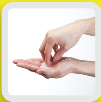
4 NETTOYER LES ONGLES