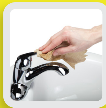
7 FERMER AVEC LE PAPIER